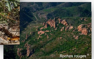
Roches rouges 5