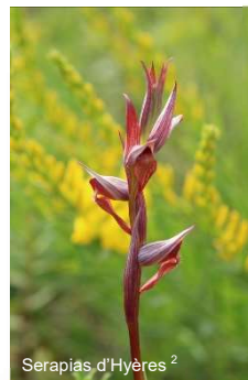
Serapias d'Hyères 2

Cet ensemble possède par ailleurs des patrimoines culturels, archéologiques, architecturaux, artistiques remarquables et des savoir-faire et traditions qui ont forgé l'identité du territoire.