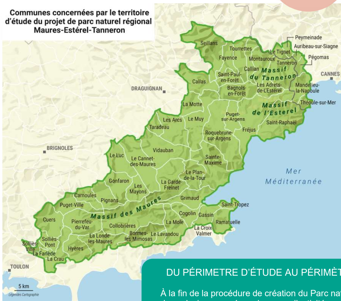
Communes concernées par le territoire d'étude du projet de parc naturel régional Maures-Estérel-Tanneron