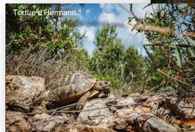
Tortue d'Hermann 4